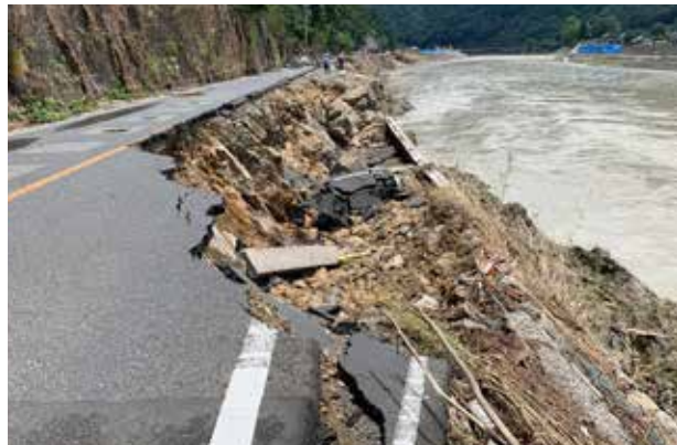
被災した国道219号坂本町荒瀬