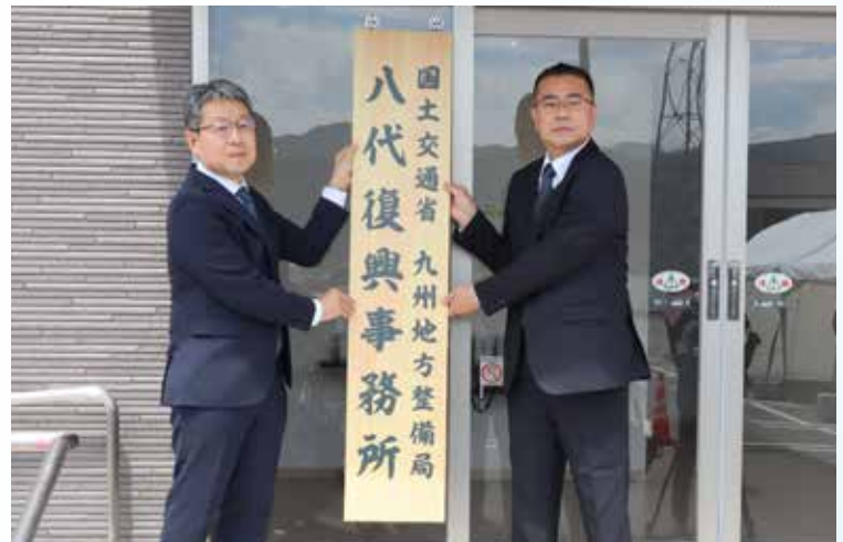
▲八代復興事務所開所

八代復興事務所は、2020年7月豪雨で被災した球磨川中流部、9支川と流失した10橋梁を含む国道219号等の道路約100kmの災害復旧を担っています。昨年9月に設置された八代復興出張所長から引き続き担当することになり、地域の期待の大きさと責任の重さを感じています。復旧・復興を加速化できる体制が整ったことにより、全体的な事業ボリュームを出し、工程を考えていくうえで今年、来年が勝負と思っています。出来ることをロスなくやっていきたいし、マネジメントが大事になると思います。