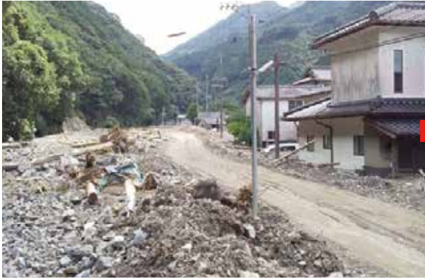
川内川（土砂・流木撤去の状況）